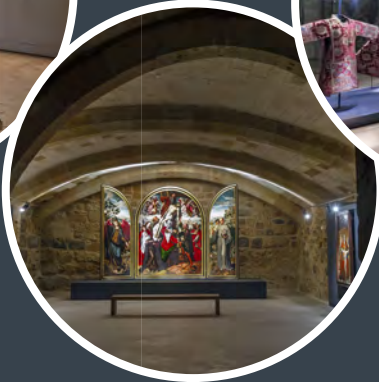
Sala de Pintura Bajo Claustro Abierta en 2018