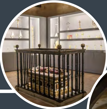
Sala de Santa Catalina Abierta en 2023

El claustro da acceso a cuatro salas de exposición abiertas a la visita cultural y que custodian parte del patrimonio artístico y religioso de la Catedral. Tres de las cuatro salas se han abierto al público desde 2017 hasta 2023.